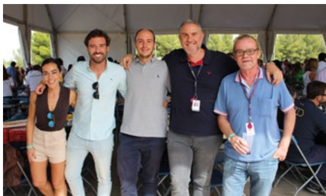
DACHSER AIR & LOGISTICS