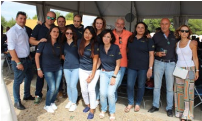
GRUPO CONTINENTAL RAIL