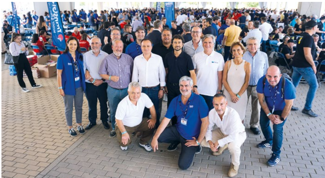
Autoridades, representantes sectoriales y miembros del Comité Organizador posaron al inicio del evento.