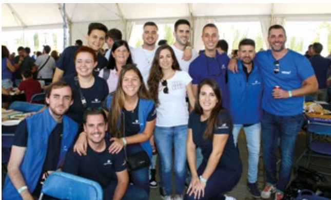
MARGUISA SHIPPING LINES