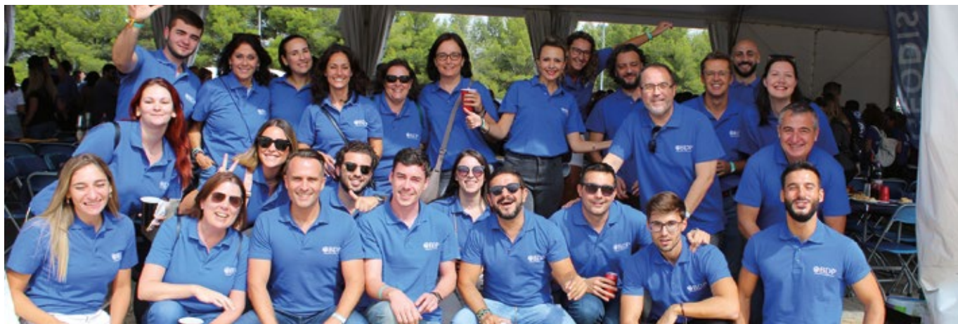
BDP INTERNATIONAL MADRID