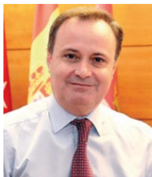
ÁNGEL VIVEROS ALCALDE DE COSLADA