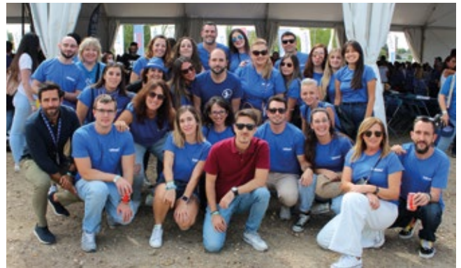
HELLMANN WORLDWIDE LOGISTICS