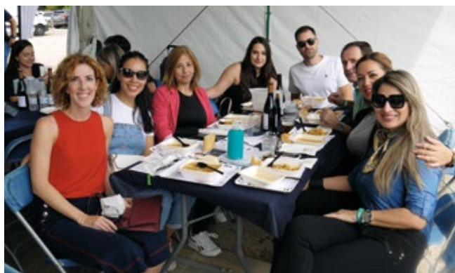
AGENCIA FERNÁNDEZ DE SOLA