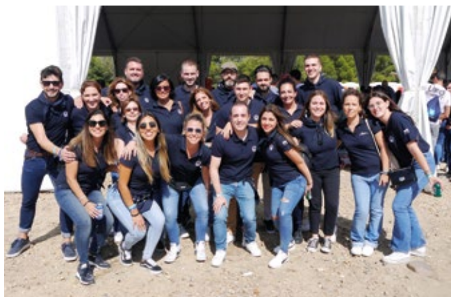
IFS INTERNATIONAL FORWARDING