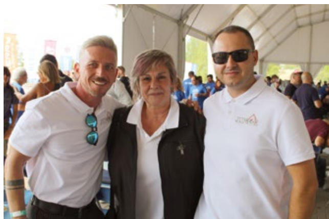
JUNIOR FREIGHT FORWARDING