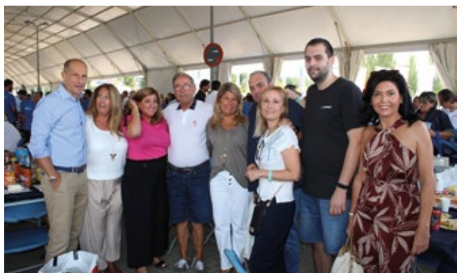
INTERNATIONAL TRADE SOLUTION