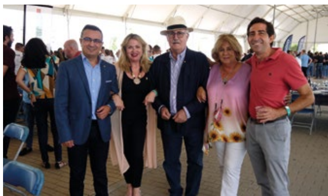
PROPELLER ALGECIRAS Y PROPELLER SEVILLA