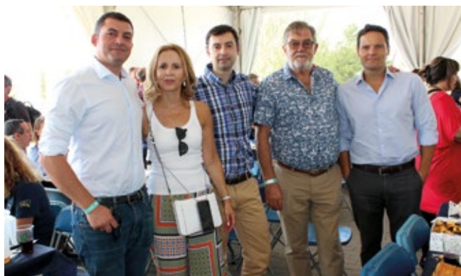
PUERTO SECO AZUQUECA