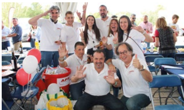
ADUANAS PUJOL RUBIO