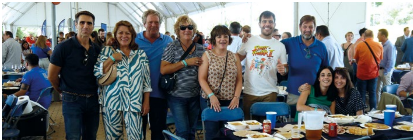
IC MARITIME SERVICES