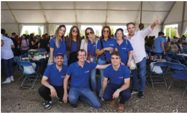
TRANSCOMA GLOBAL LOGISTIC (TGL)