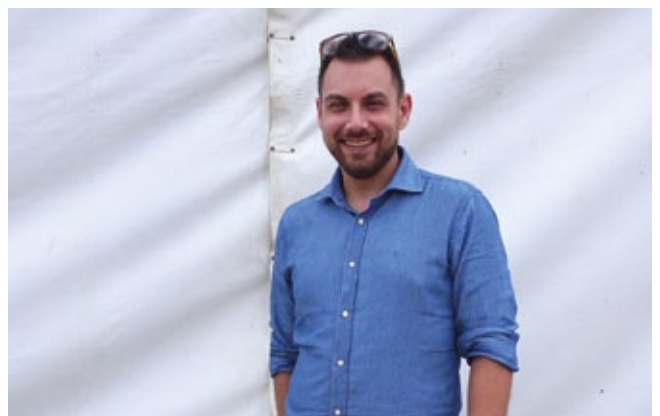
WRL SHIPPING SPAIN